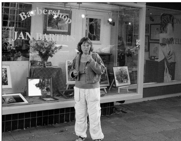
Foto's van de Amstelveense fotografe Liesbeth Jonckbloedt in de etalage van barbershop Bartels. Eigen foto.

De foto's van Liesbeth Jonckbloedt kenmerken zich door verrassende details en kleurnuances. Het mooie van haar werk is dat zij een bepaalde melancholie in haar foto's legt. Dertig jaar geleden is zij begonnen met fotograferen. Geïnspireerd door de doka (donkere kamer om foto's te ontwikkelen) van haar vader en geboeid door kleurschakeringen heeft zij zich ontwikkeld tot beeldend kunstenaar van het detail. Foto's maken van kinderen vindt Liesbeth heerlijk om te